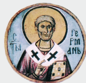
Sv. German Konstantinopolský

Má jediná útěcho, božská roso, osvěžení mého žaru, dešti, jež Bůh sesílá na mé vyprahlé srdce, svítilno zářící v temnotě mé duše, průvodkyně na cestě, oporo mé slabosti, plášti mé nahoty, bohatství v mé přehluboké bídě, léku na mé nezhojené rány, konci mých vzdechů a slz, vysvobození z každého neštěstí, úlevo v bolesti, vykoupení z mého otroctví, naděje mé spásy. Amen, Paní má, amen, mé útočiště, živote můj a pomoci má, má záštito a slávo, má naděje a sílo.